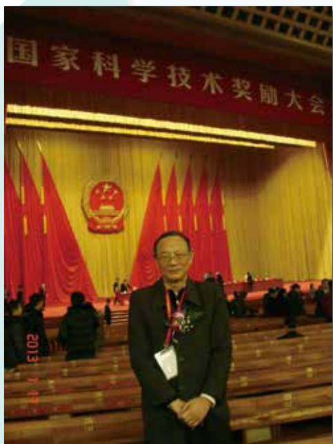
图3 王祥珩教授在人民大会堂参加2012年度国家科学技术奖励大会